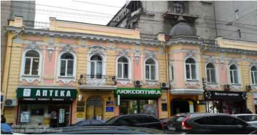
Будинок Федецького по вул. Сумській, 3