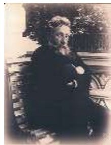
Портрет О.К. Алчевського, 1901

У березні 1893 року Петро Ілліч приїхав до Харкова. Репетиції, підготовки до концерту. І ось нарешті сам концерт, після якого вдячна публіка під супровід привітань і аплодисментів посадила композитора у фаєтон, в якому його відвезли в ательє Альфреда Федецького. Зроблені фотознімки надзвичайно сподобались композитору. «Я отримав зараз фотографії мої від Федецького. Він, як виявилось, першокласний фотограф; принаймні я кращого нічого не бачив...», – писав Чайковський директору Харківського музичного училища І. Слатіну.